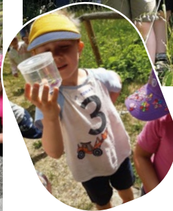
Unser Naturparkprojekt 2026 stand unter dem Motto: "DIE WIESE". Mit Becherlupen und vollem Einsatz erkundeten wir die Wiesen am Pöllauberg. Dabei konnten viele kleine Tiere und Pflanzen bestaunt werden.