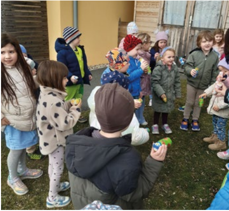
Der Frühling wurde mit selbstgebastelten Rasseln aufgeweckt.