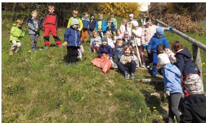
Alle Kinder halfen ganz eifrig beim Frühjahrsputz am Pöllauberg mit.