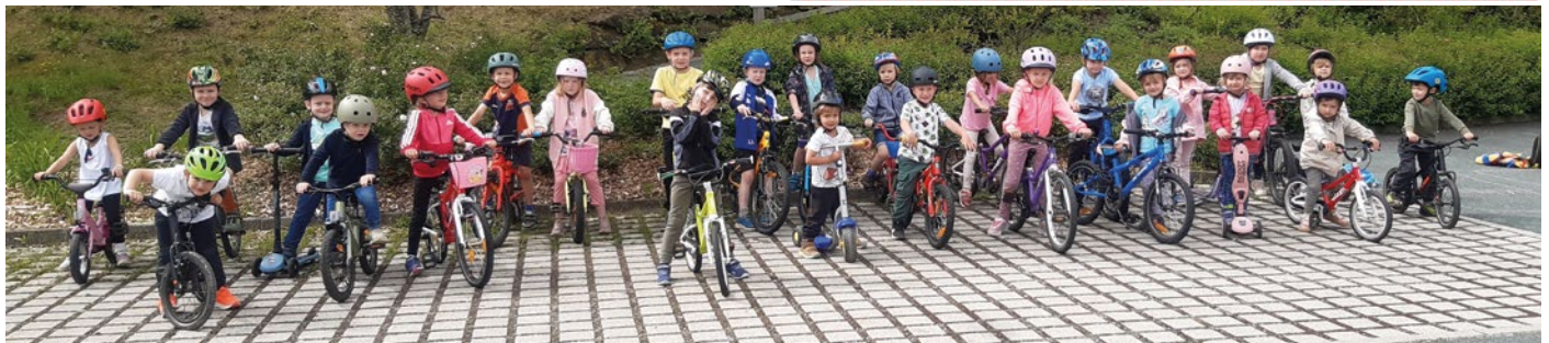
Sportlich und sehr rücksichtsvoll fuhren die Kinder beim Fahrradtag vor der Naturparkarena.