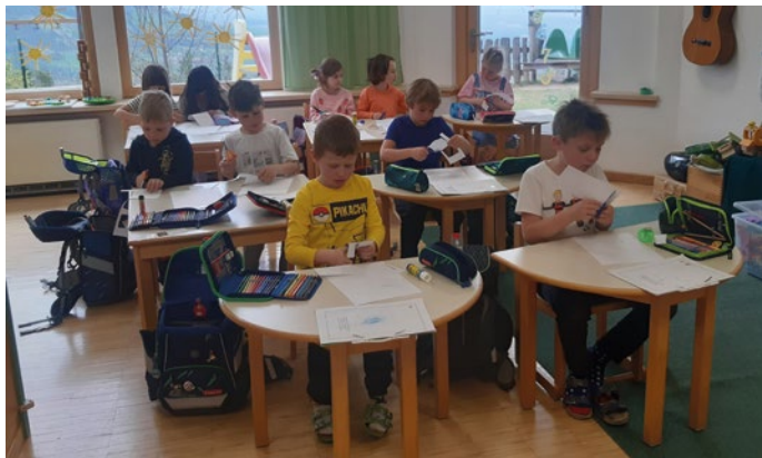
Unsere 10 Schulanfänger in der "Kindergarten Schule".