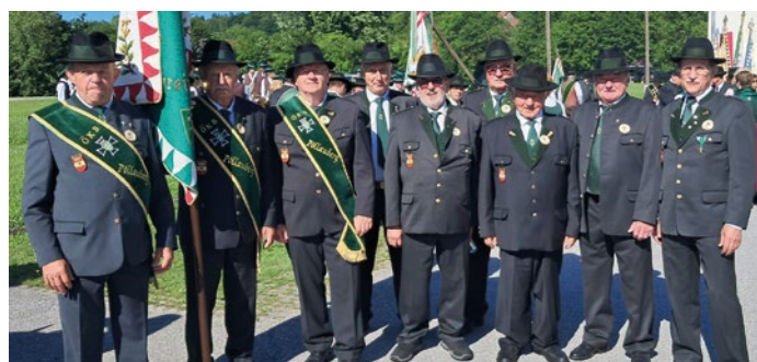
Der OV Pöllauberg gratulierte zum Bezirkstreffen und 155 Jahrfeier dem OV Markt Hartmannsdorf.