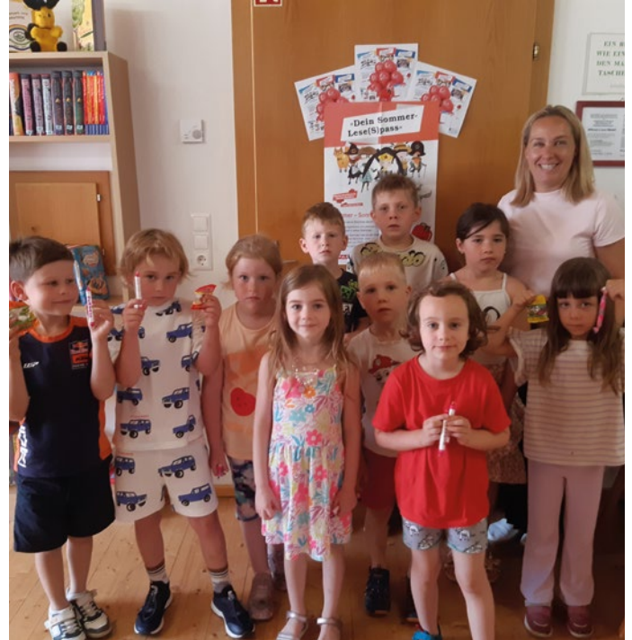
Besuch in der Bücherei