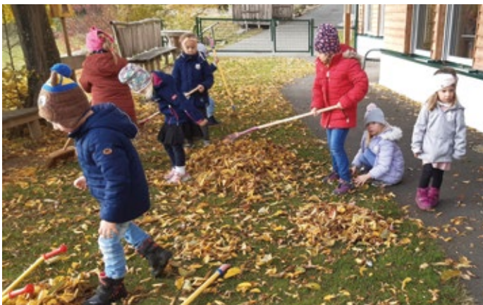
Beim Laubzusammenrechen hatten die Kinder viel Spaß.