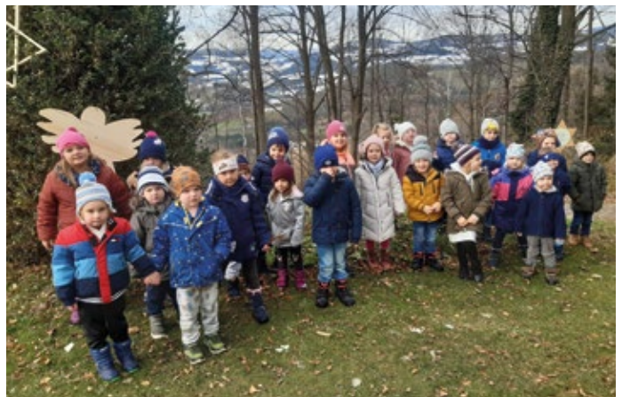
Auch den Kindergartenkindern hat der Krippenweg sehr gut gefallen.