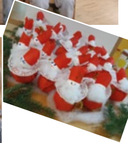
Für das Nikolausfest bastelte sich jedes Kind einen Nikolaus und eine Nikolausmütze.