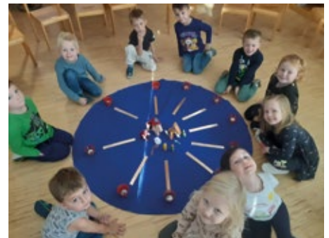
Beim Laternenfest dachten wir an den Hl. MARTIN und erleuchteten mit unseren Laternen den Pöllauberg. Wir hörten auch die Legende vom Hl. Martin.