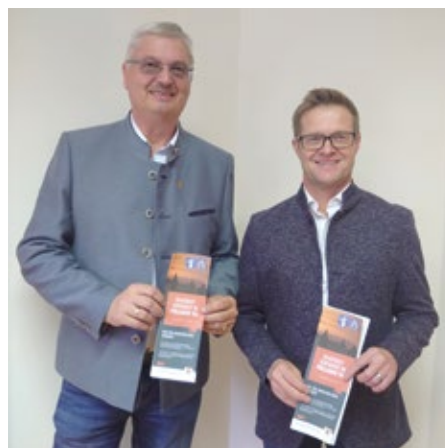
Die beiden Bürgermeister präsentieren den neuen Blackout-Vorsorge-Folder der Region Naturpark Pöllauer Tals.

ger, ist ein weiterer Meilenstein gelungen. Er ist ab jetzt in der Region erhältlich, und steht auch als Webversion unter www.klima-naturpark-poellauertal.at zur Verfügung.