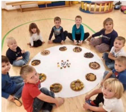
Im Turnsaal legte jedes Kind ein Herbstmandala.