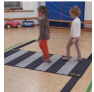
Passend zum Nebel im November nahmen wir wieder am Projekt "Das kleine Straßen 1x1" teil. Wir übten das richtige Überqueren der Straße und lernten, wie wichtig es ist, dass man sich als Fußgänger sichtbar macht.