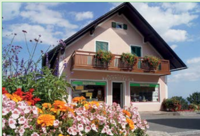
Kaufhaus Töglhofer „3 Floras“