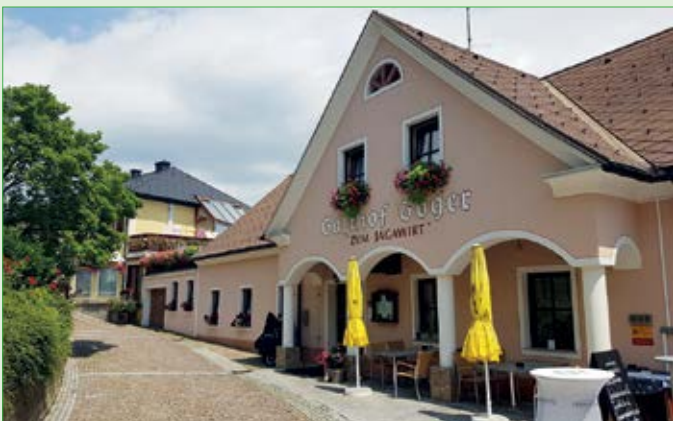
Gasthof Goger „3 Floras“