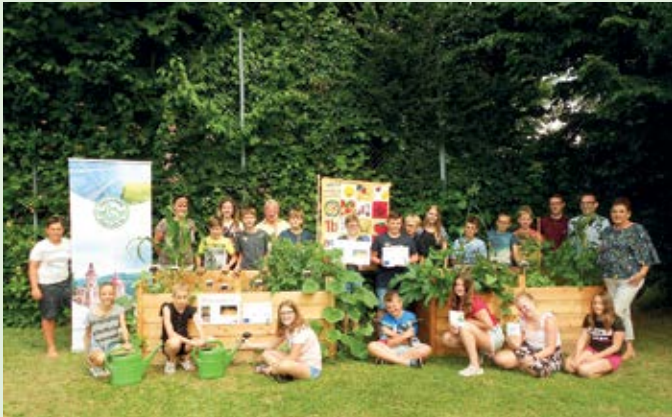
„NATURPARK-JUGENDARBEIT: ROOTS“ mit der Klasse 1b der NMS Pöllau

Dieses LEADER-Projekt wurde mit Mitteln der EU und des Landes Steiermark gefördert und über die LEADER-Region Zeitkultur Oststeirisches Kernland abgewickelt.