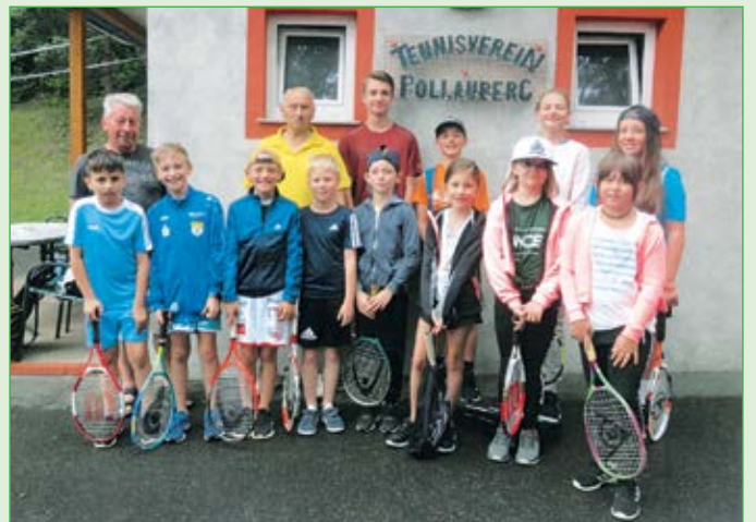
Teilnehmer des diesjährigen Kindertenniskurses.

Wir wünschen unserem Fußballnachwuchs alles Gute für die kommenden Turniere bzw. Meisterschaftsspiele und einen verletzungsfreien Herbst.