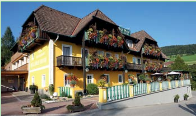
Waldhof Restaurant Muhr „4 Floras“