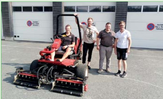
Ankauf des Spindelmähers Toro