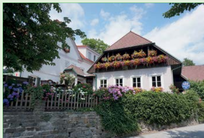
Berggasthof König „3 Floras“