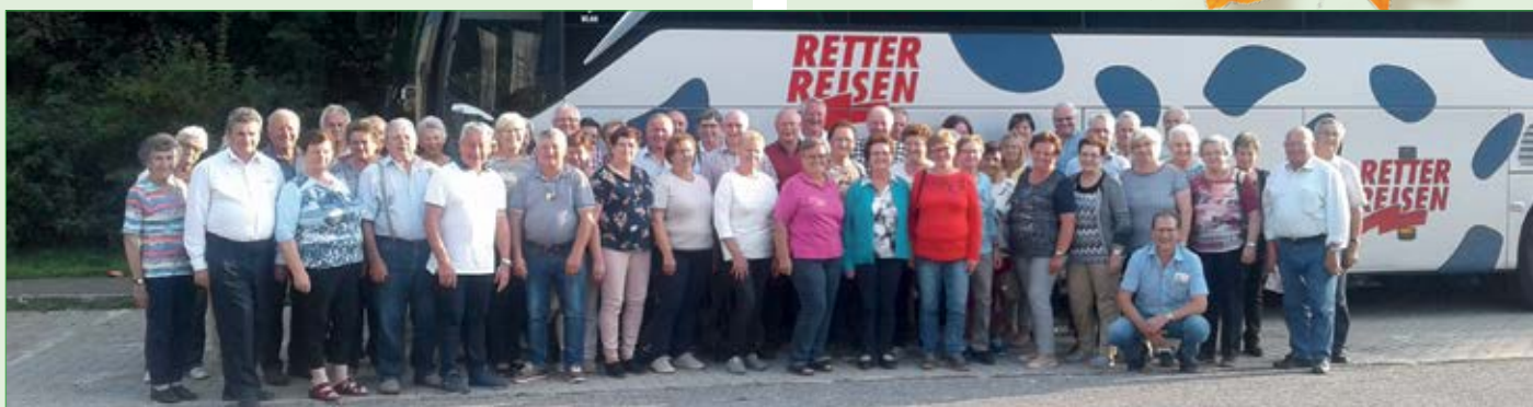
Der Seniorenbund beim 4-tägigen Ausflug nach Tirol.