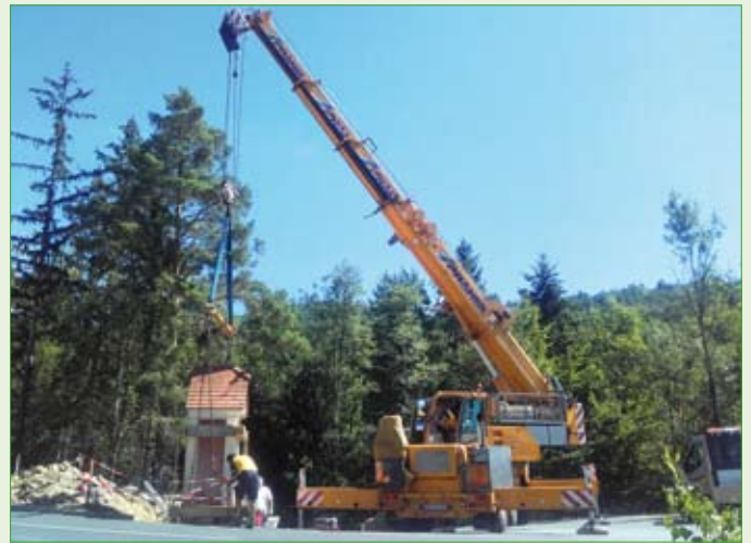
Verlegung der Ausfahrt Goldbergstraße