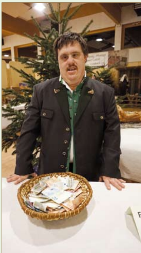
Der Reinertrag von „Advent am Berg“ kommt der Lebenshilfe Pöllau zugute!