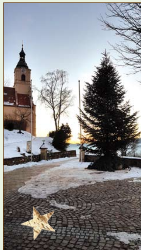
Danke Familie Sepp und Sylvia de Buigne, vlg. Zeil-Kratzer, für die heurige Christbaumspende!