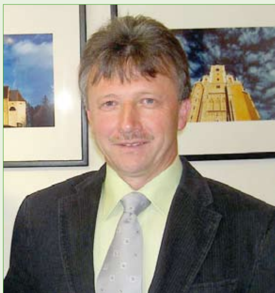
... Hubert Lang zum Landtagsabgeordneten der Steiermark.