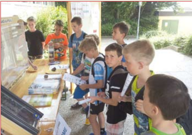
Beim Energie-Projekttag lauschten unsere Kinder der 3. + 4. Stufe gespannt den Ausführungen der Schüler der NMS Pöllau und der Polytechnischen Schule Pöllau. Diese hatten interessante Informationen zu den Themen „Strom, Wasser, Wärme und Mobilität“ vorbereitet.