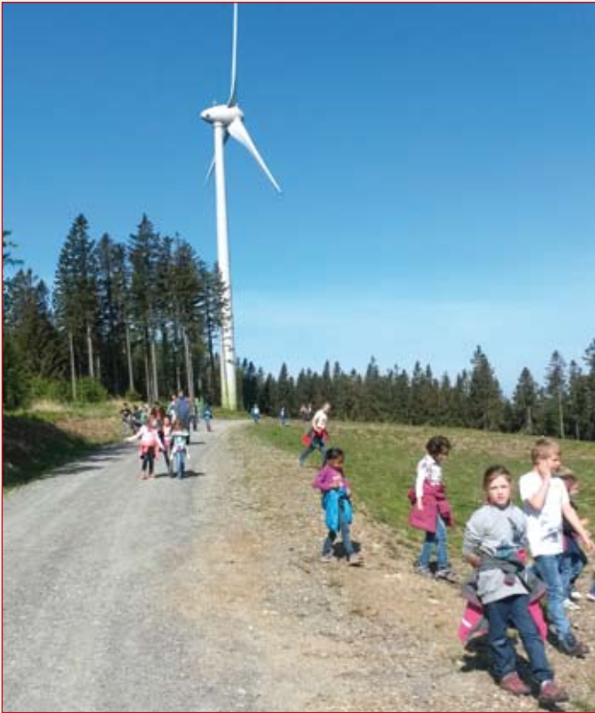
Alle Kinder besuchten den nahegelegenen Windpark am Pongrazer Kogel.